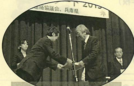
モデルとなる 広場の顕彰