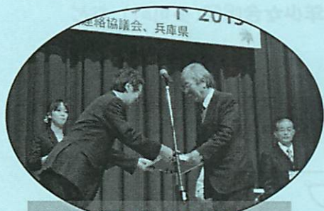
モデルとなる 広場の顕彰